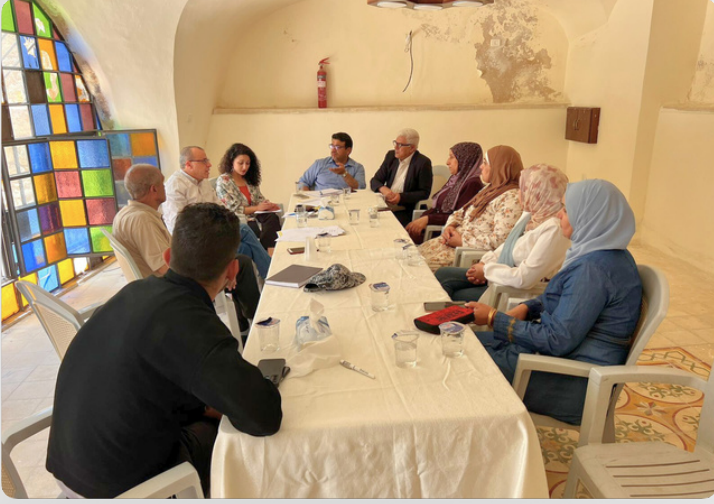
زيارات ميدانية للبحث عن قرب حول مبادرات المجموعات القاعدية ضمن أنشطة مشروع الهاكثون المجتمعي 6\2023