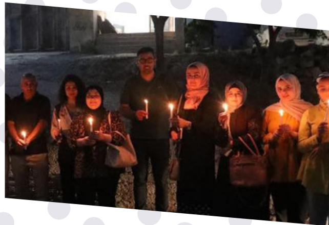
تنفيذ مبادرات مجتمعية في كل من السموع, الخضبر, بيت عوا و تفوح ضمن أنشطة مشروع الهاكثون المجتمعي 6\2023

Implementation of Community Initiatives Civic Hackathon Project 2023\6