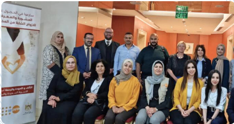
Participation in the workshop for preparing the Pre-marriage counseling guidebook in cooperation with the Ministry of Health 6\2023