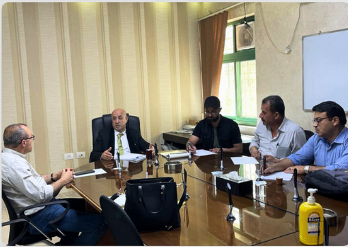
Field Visits to grassroots groups Civic Hackathon Project 6\2023