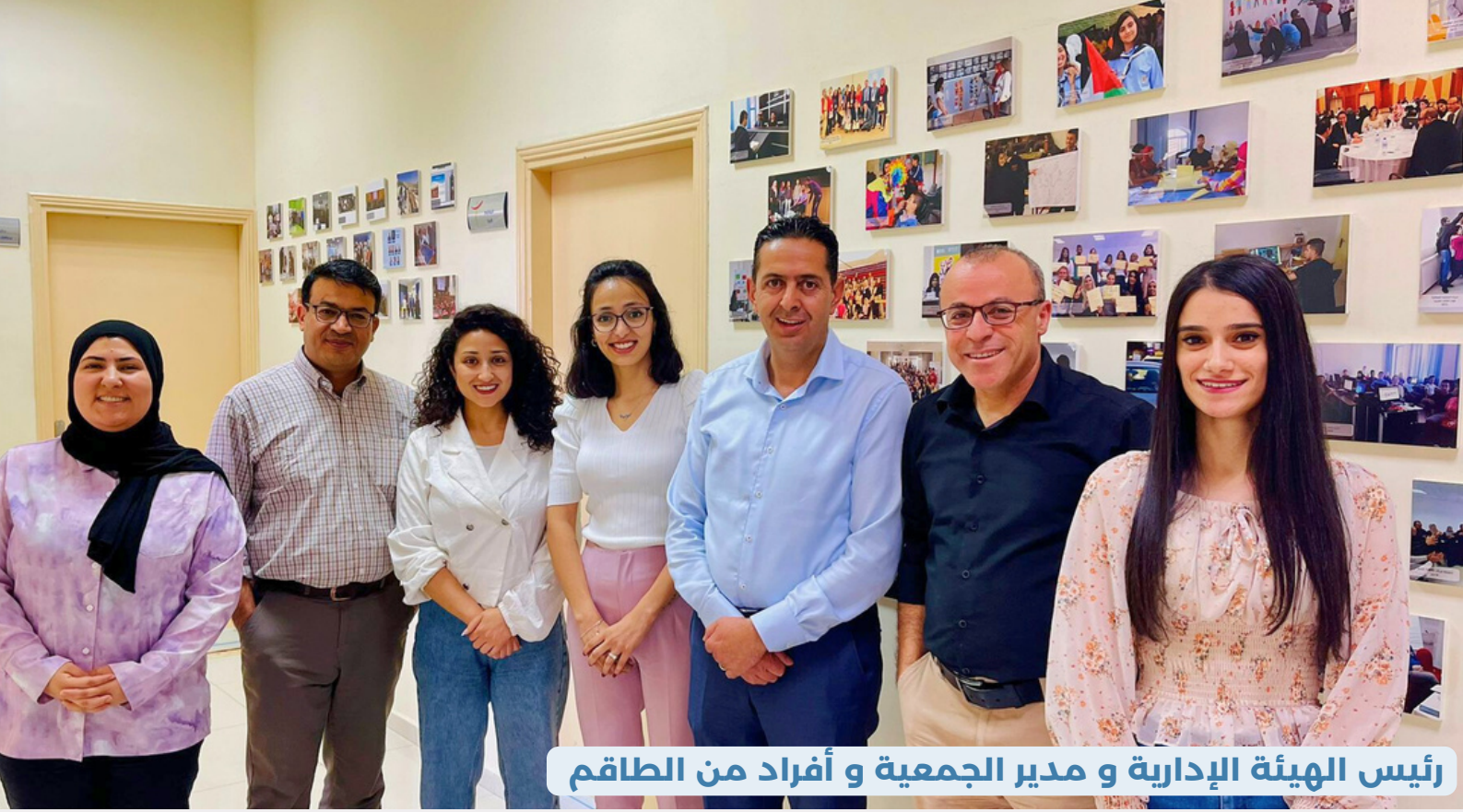
رئيس الهيئة الإدارية و مدير الجمعية و أفراد من الطاقم

جمعية التنمية المجتمعية والتعليم المستمر